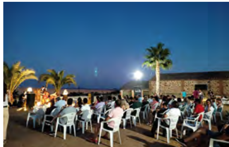
Observando las estrellas del Guadiato