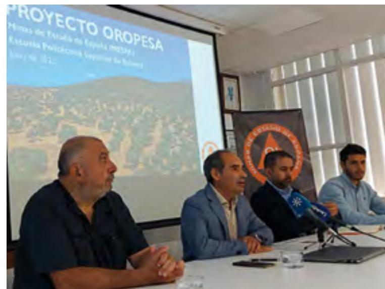
Asistentes a la presentación del proyecto Oropesa

Incluido como uno de los proyectos estratégicos de la Unidad Aceleradora de Proyectos de la Junta de Andalucía, la compañía Minas de Estaño de España planea explotar el yacimiento Oropesa en