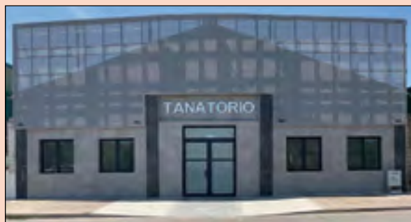
Tanatorio de Belmez