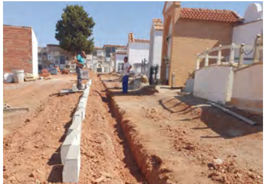
Trabajos de construcción del acerado en el cementerio francés

El último de los objetivos no menos importante es cumplir con las condiciones que exige la Asociación Europea de Cementerios Singulares (ASCE), agente oficial