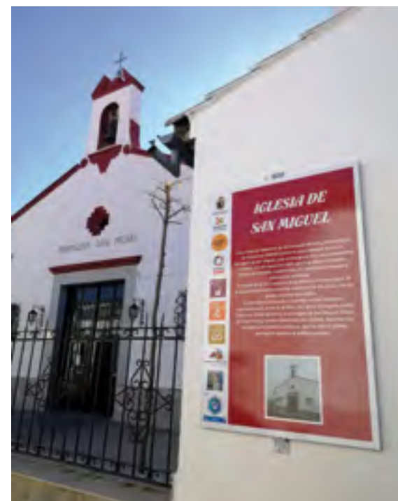
La parroquia de San Miguel es uno de los edificios en los que se ha colocado un panel informativo