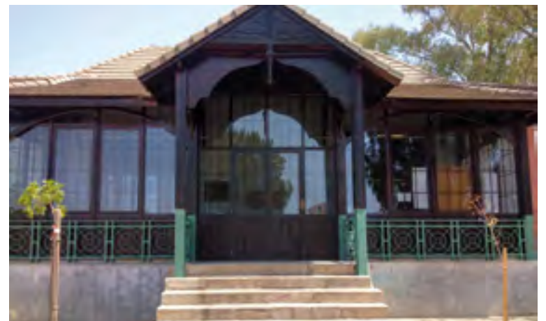
Vista de la Biblioteca Municipal