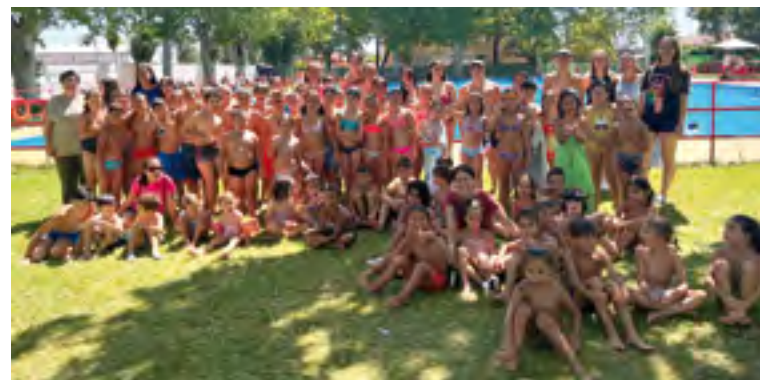
Participantes y monitores de la Escuela de Verano

Cada jornada de trabajo y diversión comenzaba en las instalaciones del CEIP San José de Calasanz, donde se han desarrollado talleres de psicomotricidad, de estimulación cognitiva y de desarrollo físico-motor, para continuar con la realiza-