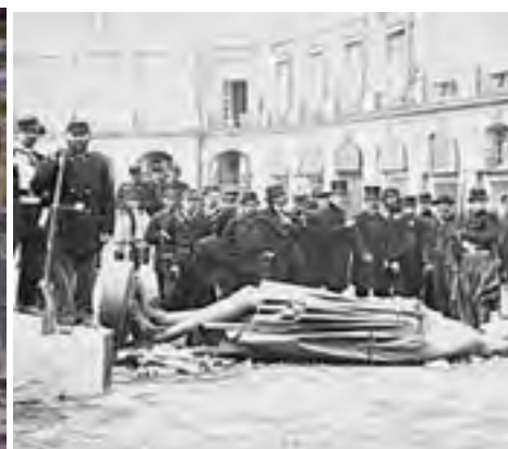
Derrumbe de la estatua de Napoleón