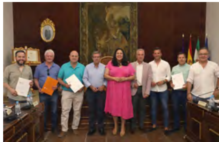
Acto de firma del convenio con el GDR

La cuantía total de los convenios suscritos asciende a 175.000 euros, 25.000 euros para cada Grupo de Desarrollo Rural.