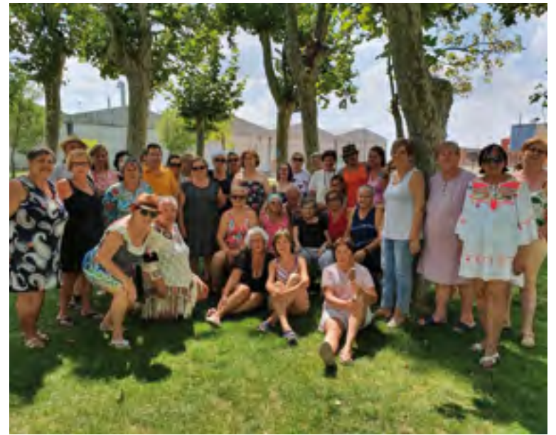
Participantes en la edición de este año del Aquagym

Expósito señaló que "el Ayuntamiento va a seguir apostando por este tipo de actividades que contribuyen a mejorar la salud de nuestros mayores, y que podamos contar con un sector de población activo ya que disponen de tiempo para ello".