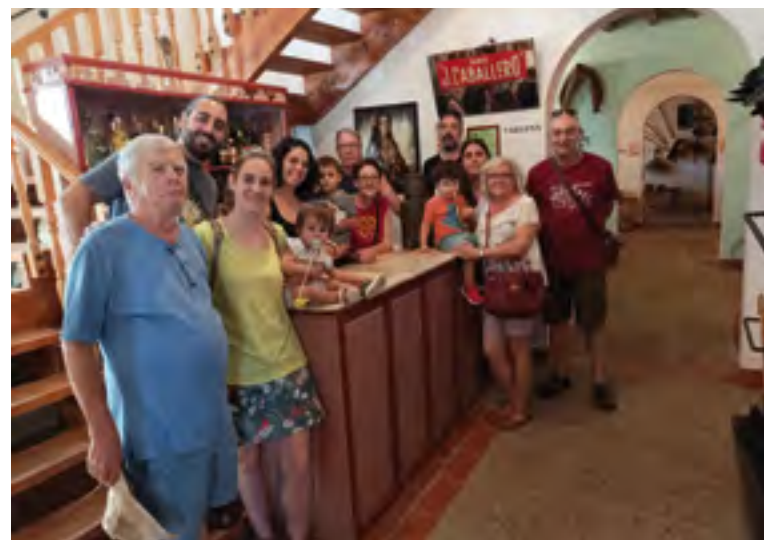
Visitantes en el Museo de Usos y Costumbres

Por mi parte, tengo que reconocer la envidia sana que me da cada vez que visito este museo de Posadilla, al que por cierto, pueden visitar todos aquellos grupos escolares desde primaria a bachillerato, asociaciones de mayores, asociaciones de vecinos o grupos particulares que lo soliciten por anticipado, como así vienen a haciendo a lo largo de todo el año, igual que lo hemos hecho nosotros en este