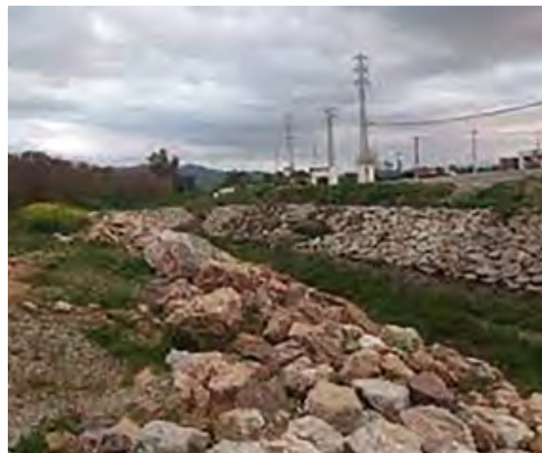
Vista del arroyo de la Hontanilla