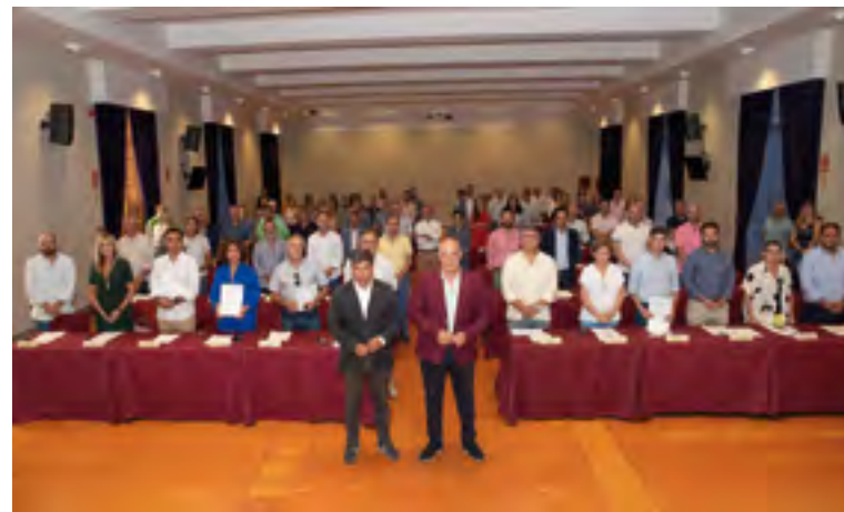
Acto de firma de los convenios del Plan Córdoba 15

Llamas insistió en "el trabajo que se viene realizando para poner