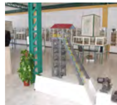
Museo Geológico-Minero de Peñarroya-Pueblonuevo

rando actividades económicas que creen oportunidades laborales para que la gente se quede a vivir en el medio rural. El objetivo es frenar la despoblación que, en el caso de Córdoba, afecta especialmente a comarcas como Los Pedroches.