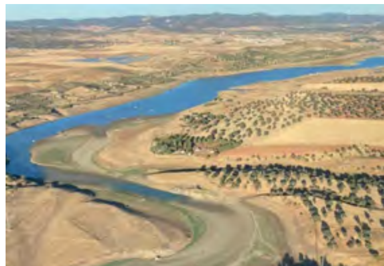
Estado del embalse en la actualidad

Para ello, están previstas otra serie de actuaciones como son la terminación de los pocos metros