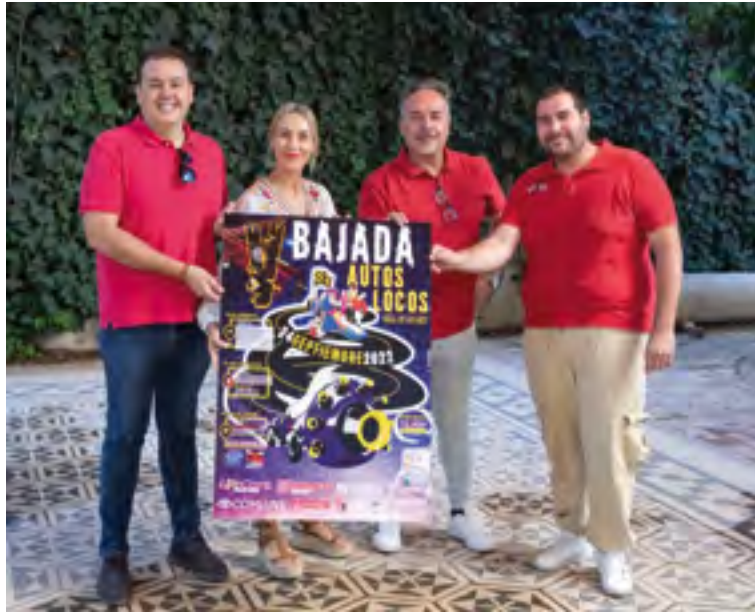
Acto de presentación de la Bajada de Autos Locos

Al mismo tiempo, la diputada ha subrayado que "este tipo de eventos posibilitan la convivencia y el intercambio cultural y de experiencias