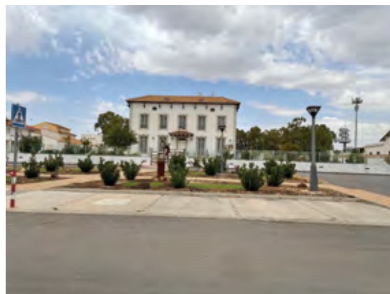
Instalaciones del complejo Las Minas

Expósito avanzó que además están trabajando con una iniciativa sociosanitaria que se podría desarrollar en este espacio, "al mismo tiempo, estamos trabajando con una nueva iniciativa privada interesada en desarrollar un proyecto sociosanitario, y si fuera posible, ésta podría ser una de las posibles ubicaciones para el desarrollo del mismo".