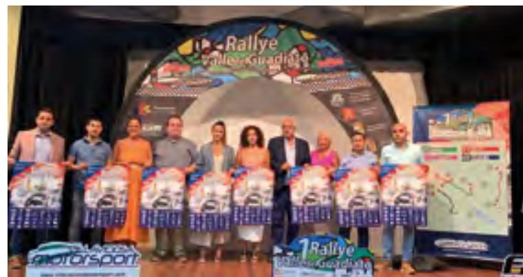
Acto de presentación del rallye

Tramos 2-4 Villaharta: Con una longitud de 15km es uno de los tramos más completos y técnicos a defender de este Rallye, ya que consta con una bajada muy complicada que empieza en el puerto de la Chimorra y que termina en una subida con múltiples curvas.