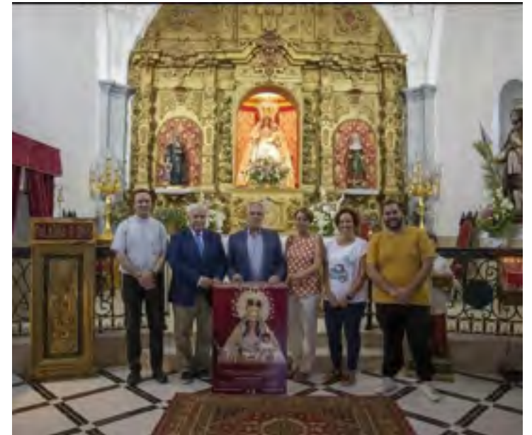
Presentación del cartel de Feria