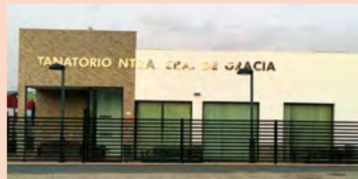
Tanatorio Ntra. Sra. de Gracia Fuente Obejuna