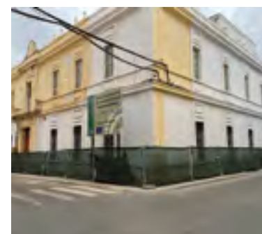
Estado actual del Ayuntamiento

El regidor avanzó que una vez supervisado se convocará una comisión de seguimiento en la que se informará de los plazos.