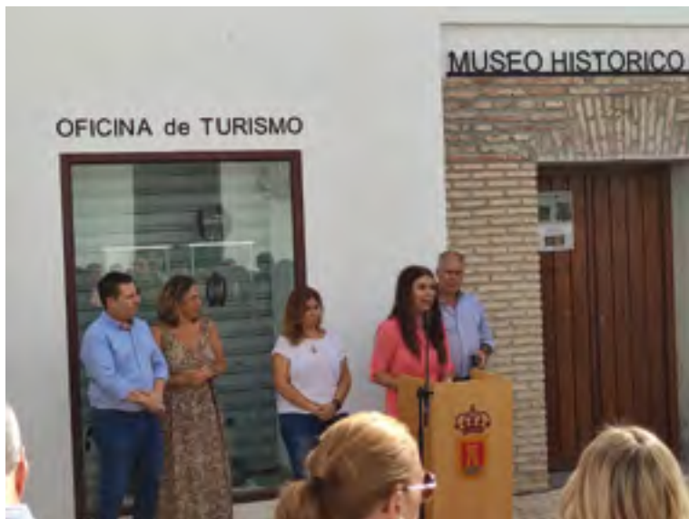
Acto de reapertura del museo

pósito de la Villa, Calle Córdoba 3. Aunque en la actualidad se encuentra anotado como Museo eminentemente arqueológico, cuenta entre sus fondos con secciones de Arqueología, Minería histórica, Paleontología y Mineralogía y, finalmente Museo del Territorio. Sus fondos fundacionales los constituyen parte de los materiales procedentes de las campañas de excavación de la Mina de la Loba (Fuente Obejuna) y una gran aportación de materiales del Seminario Antonio Carbonell, así como de particulares, dando forma a una exposición de gran variedad cronológica y temática, que se van viendo ampliados gracias a la labor de concienciación social llevada a cabo por la Dirección del Museo, de cara a la recuperación del Patrimonio Histórico-Artístico belmezano en manos de particulares.