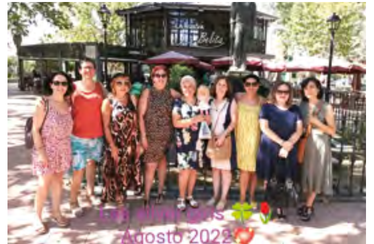
"Café con amigas del colegio"